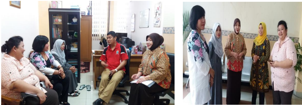
Gambar 1. Pemetaan sosial terkait kekerasan verbal orang tua terhadap anak di Kantor Kecamatan Kembangan, Jakarta Barat, 24 Juli 2018