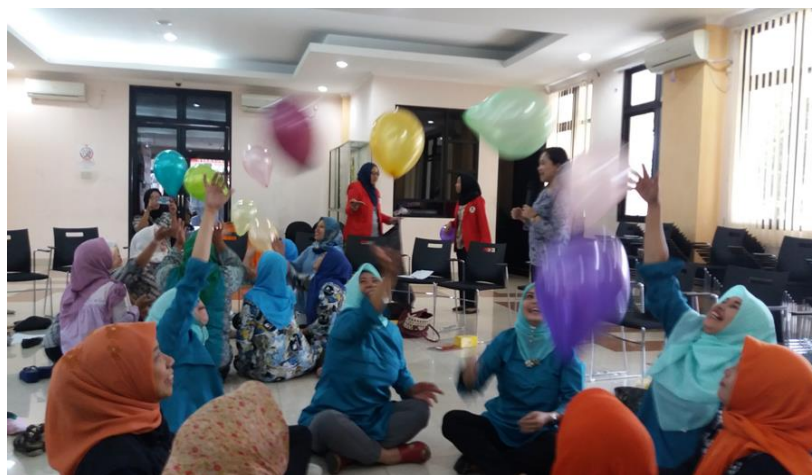
Gambar 3. Sosialisasi Pembentukan Konsep Diri Orang Tua Melalui Theraplay di Kantor Kecamatan Kembangan, 03 Agustus 2018