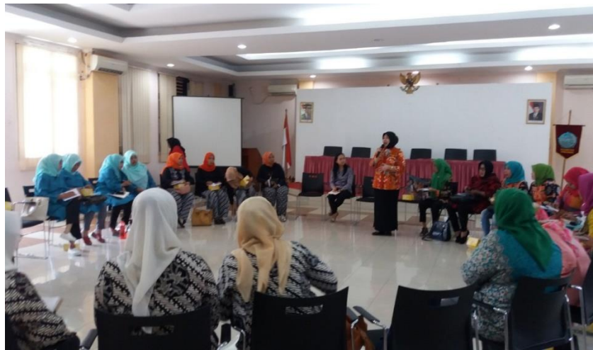
Gambar 2. Sosialisasi Pembentukan Konsep Diri Orang Tua Melalui Theraplay di Kantor Kecamatan Kembangan, 03 Agustus 2018